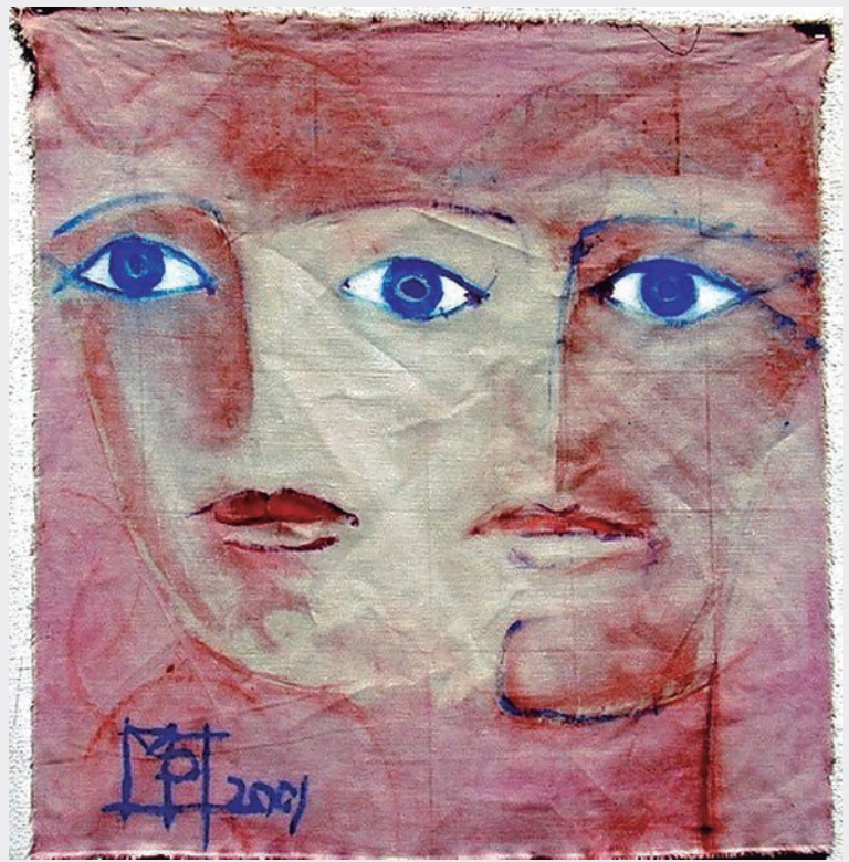
«Unitrinitè», pintura sobre tela de Michel Pochet.

(Fragmento de «María, humanidad realizada» en A los Gen, diálogo con los jóvenes , Ciudad Nueva, 1979, pp. 157-161)